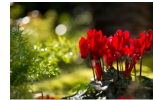
ガーデンシクラメン (冬～春) Garden cyclamen (Winter - Spring)