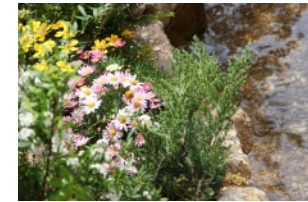
春のうららかな水辺 Spring