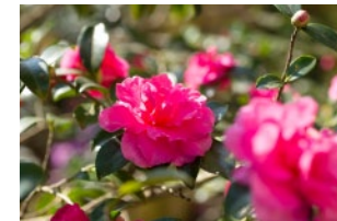
ツバキ (晩秋～冬) Camellia (Late autumn - Winter)