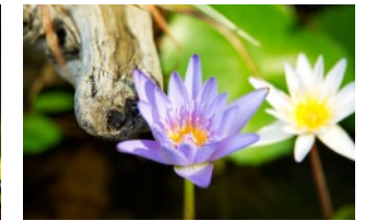
スイレン (夏) Water lily (Summer)