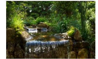
夏のビオトープ付近 Summer