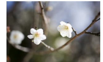
ウメ (冬) Plum (Winter)