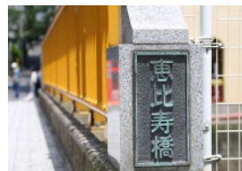
黄色い欄干が目印の恵比寿橋