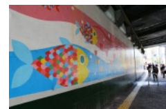
恵比寿駅前の高架下