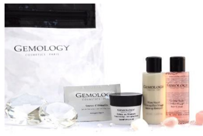
宝石由来コスメ「ジェモロジー」