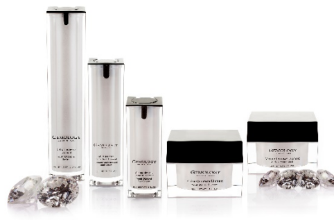
宝石由来の成分配合コスメ「ジェモロジー」

夕食はホテル2階の日本料理「舞」にて、料理長がこのプランのためだけに考案した美肌効果を高める旬の素材を使った栄養価の高いヘルシーなコースをご用意しています。エグゼクティブフロアの客室で夜景を堪能し、ヘブンリーベッドで深く穏やかな眠りについた翌朝はアクアエリアでリフレッシュ。17階のエグゼクティブラウンジでの朝食を終える頃には、昨日よりつやめく肌、エネルギー溢れるボディを実感いただけることでしょう。